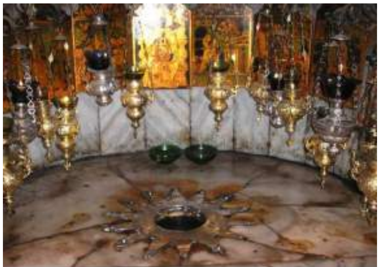
LOCUL UNDE S-A NĂSCUT IISUS HRISTOS