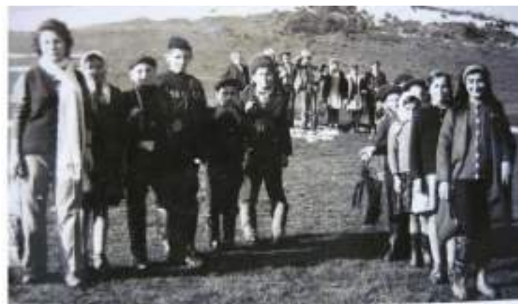
Practica agricolă: întoarcerea de la livada din Vurpăr

Începând cu anul școlar 1920 – 1921 avem la dispoziție atât matricole cât și cataloage. Date mai clare avem despre elevi și ( partial ) despre cadrele didactice (învățători; profesori). Din păcate, învățătorii nu își scriu numele complet pe documente și doar descifrând semnăturile putem afla numele acestora. Pe matricola anului școlar 1920/1921 este scris ( 2 ) „ Matricola școlii primare naționale din comuna Ghijasa inferioară, județul Târnava Mare...La pagina 2 este adăugată, cu creionul, notația „ Regatul României... Numărul elevilor școlarizați este variabil ( 3 ): în 1922/1923 – 121 elevi; în 1923/1924 – 84 elevi; în 1924/1925 – 77 elevi. După 1930 numărul elevilor crește semnificativ: 1931 – 104 elevi; 1932 – 114 elevi; 1933 – 115 elevi; 1934 – 125 elevi. Maximul se atinge în anul școlar 1936/1937 – cu 144 elevi. Numărul de elevi care reușeau să facă 5-6-7 clase este relativ scăzut: în anul școlar 1932/1933 doar 26 elevi erau înscriși în clasele V-VII iar în clasele I-IV erau 88 elevi.