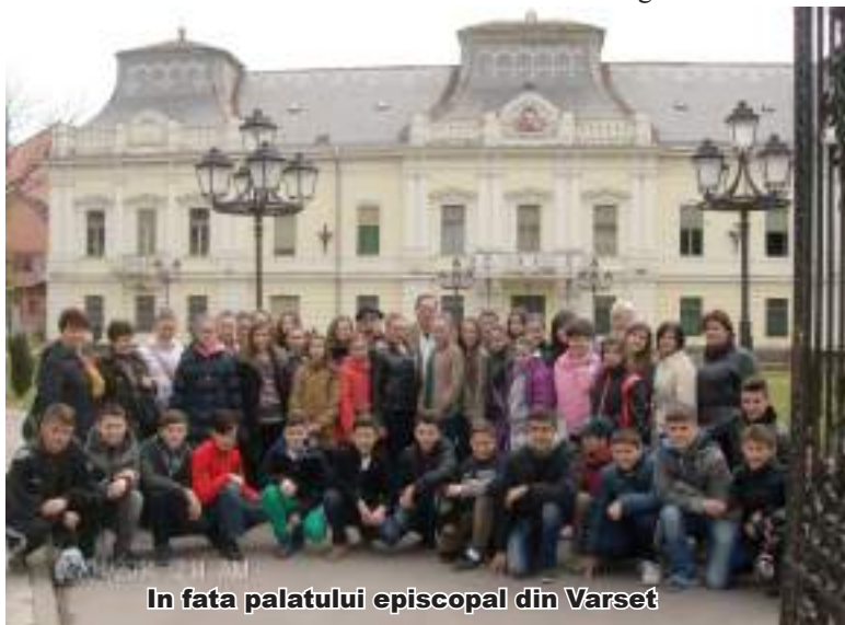
In fata palatului episcopal din Varsset

Sâmbătă, 12 aprilie, am avut un program destul de încărcat. Am vizitat orașul Vârșeț, de data aceasta cu ghid calificat pus la dispoziție de gazdele noastre. Acesta ne-a dus la unele dintre obiectivele