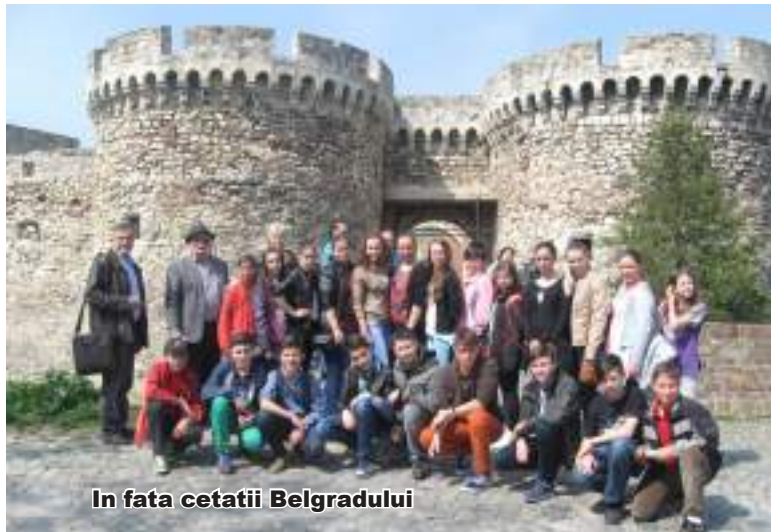
In fata cetatii Belgradului

Ziua de duminică, 13 aprilie, am petrecut-o în Vladimirovăț împreună cu gazdele noastre. Înainte de masă ne-am întâlnit la școală unde, pe terenul de sport, au avut loc întreceri sportive între elevii noștri și cei din localitate; băieții au jucat fotbal iar