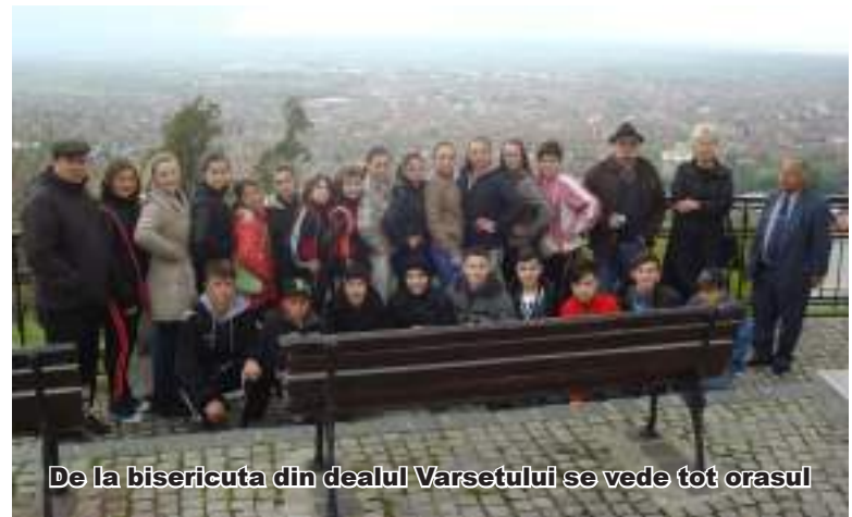
De la bisericuta din dealul Varsetului se vede tot orasul

În scurt timp am ajuns din nou la Dunăre, la intrarea ei în Defileul Porților de Fier. De aici începe parcul național Djerdap, înființat în 1983, cu o suprafață de 64.000 ha, unul dintre cele mai importante din Europa care merge paralel cu Dunărea pe o fâșie între 2 și 8 km. Ore în șir am mers pe o șosea destul de pușin circulată, pe malul Dunării, desfășându-ne privirile cu niște peisaje încântătoare. Am mai întâlnit un fort de apărare