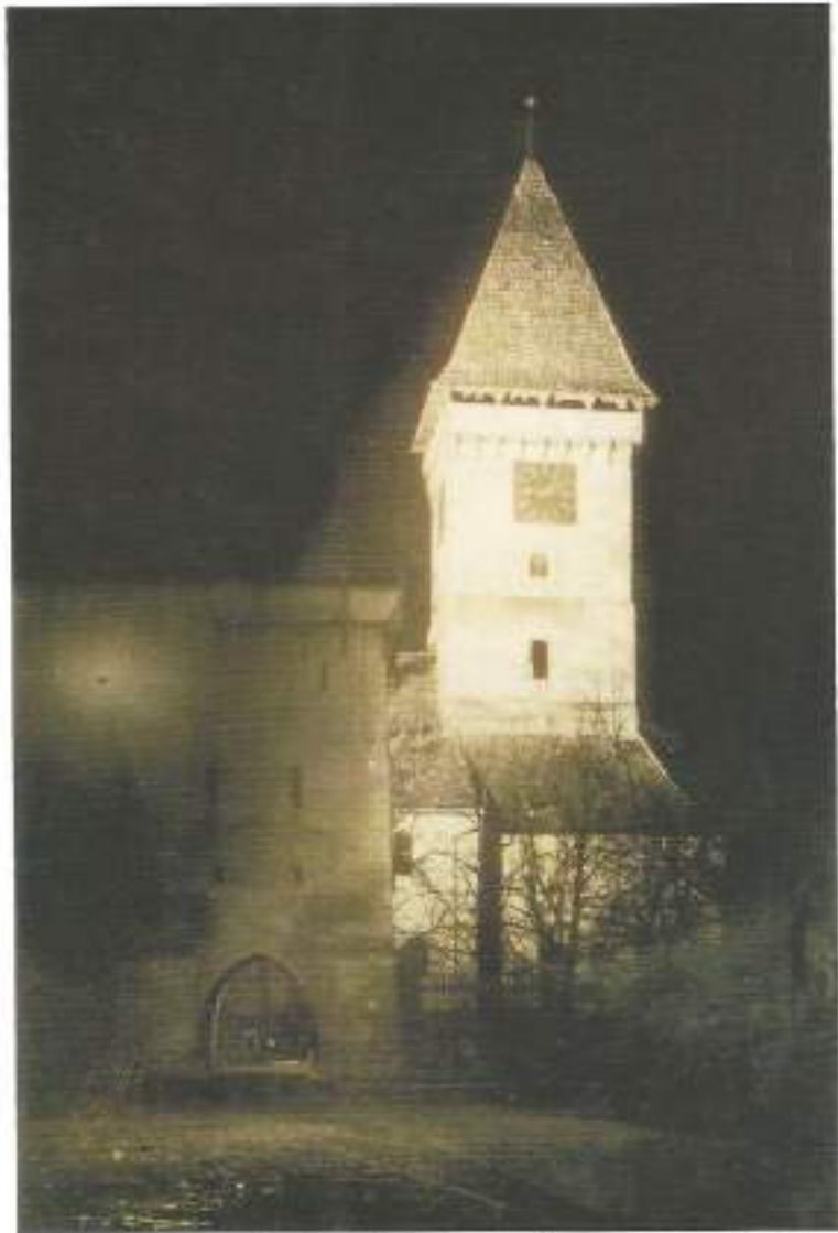
Foto 408. SETA a finalizat electrificarea localității Agnita. Foto: iluminat nocturn al Bisericii Evanghelice (~1932)

«Inaugurarea centralei Sadu I, a fost prilejul prin care Carl Wolff afirma: „Deja auzim că Brașov și alte orașe din țară au intenția de a construi uzine electrice. Fiind convinși că și alții vor primi sfaturi bune așa cum am primit noi de la Oskar von Miller vrem să sperăm că activitatea meșteșugărească din alte localități va primi un nou avânt”. Succesul electrificării Sibiului a fost apreciat de Carl Wolff drept un „îmbold pentru construirea unor centrale similare în Sebeș (Mühlbach), Reghin (Sächsisch-Regen), Sighișoara (Schässburg) și Bistrița (Bistritz).»