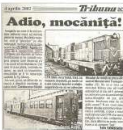
Foto 701. O altă realizare a lui Carl Wolff a fost abandonată: căleștii ferovii din Sibiu - Agnita (2002).

politici aplicată municipiului Sibiu a fost o creștere bruscă a necesarului de apă (atât pentru uz domestic dar mai ales pentru cel industrial). Singura soluție pentru a compensa creșterea consumului era amenajarea râului Cibin. (...)»