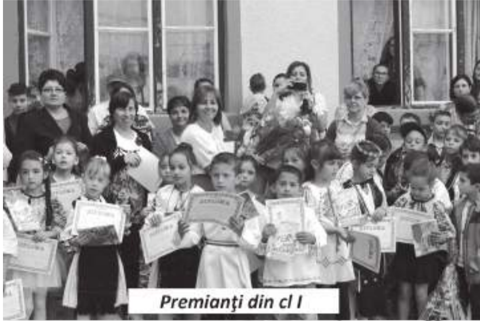
Premianți din cl I