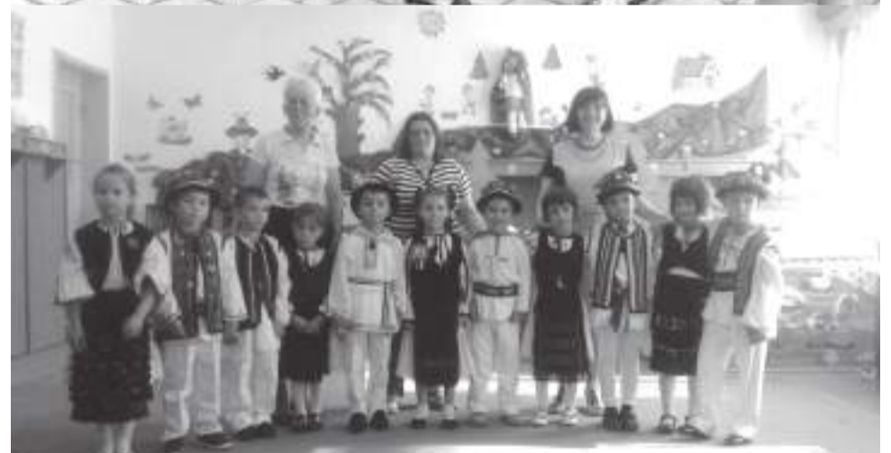
Cântăreți de muzică populară G 3