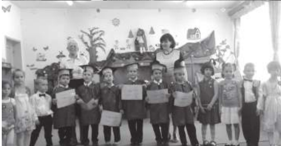
Absolvenții de la Grădinița 3