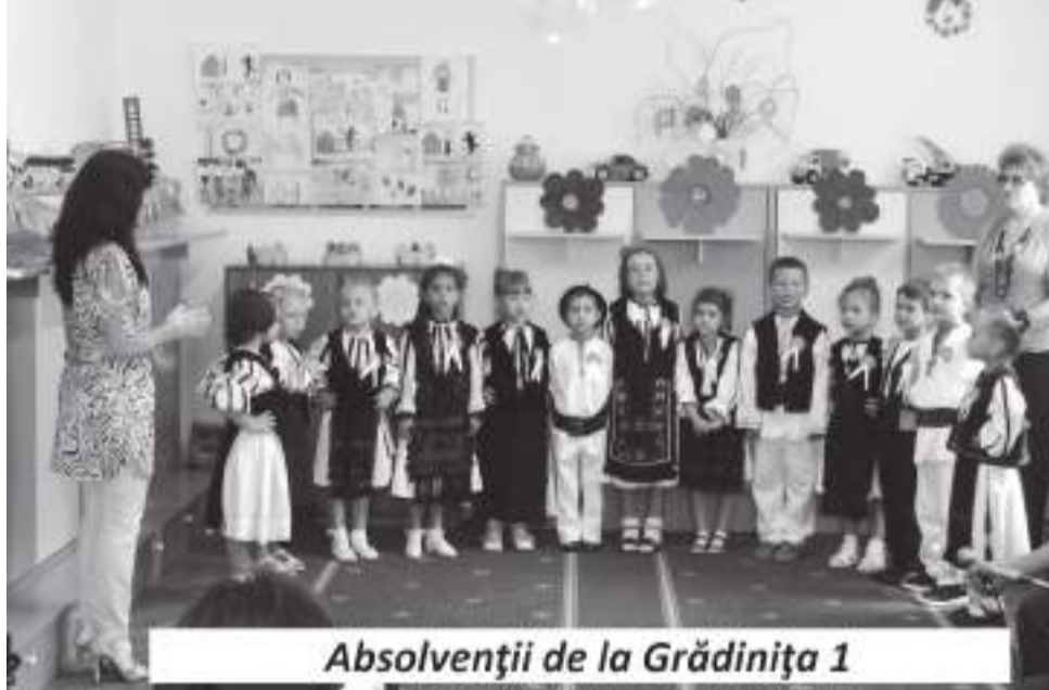
Absolvenții de la Grădinița 1