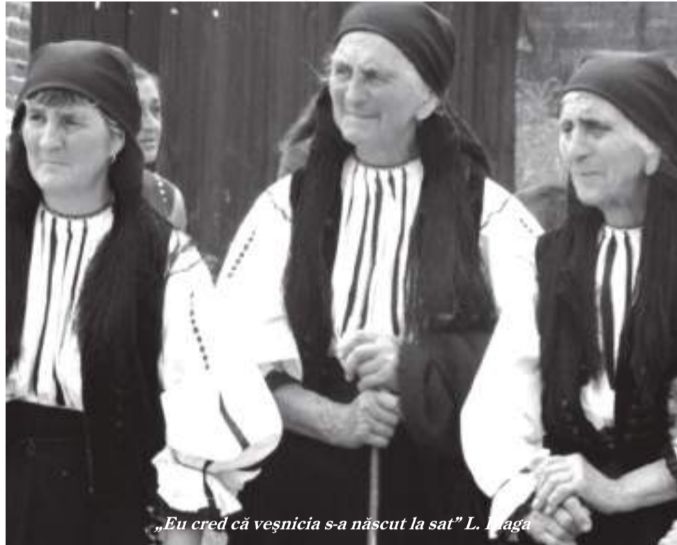
„Eu cred că veșnicia s-a născut la sat” L. Iuga

Odinioară fetele se spălau cu prima zăpadă, ca să fie mai frumoase și mai dragăstoase. Oamenii credeau că la Crăciun, Anul Nou și Bobotează animalele vorbesc la miezul nopții.