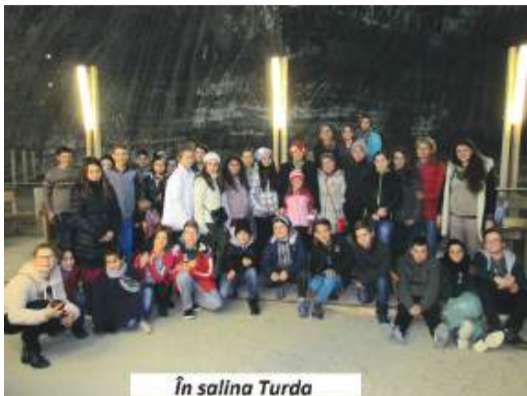
În salina Turda

„Am participat la un proiect foarte interesant și educativ. M-am bucurat că am reușit să ajutăm mediul înconjurător prin activități de ecologizare, că am avut ocazia să învăț lucruri frumoase de la profesori. Am învățat să fim mai buni și mai grijulii cu mama natură, că și ea are, la rândul ei grijă de noi, oferindu-ne aerul, verdețea și frumusețea peisajelor. Am văzut,