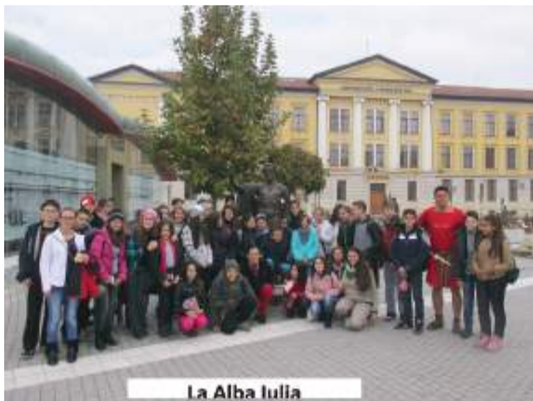
La Alba Iulia

„Din punctul meu de vedere, Olimpiadele Kaufland au avut un impact pozitiv asupra noastră, a elevilor, deoarece ne-au ajutat la perfecționarea spiritului de echipă, cât și la perfecționarea abilităților practice. De asemenea, am reușit să ne cunoaștem mai bine, să strângem legătura dintre noi, cât