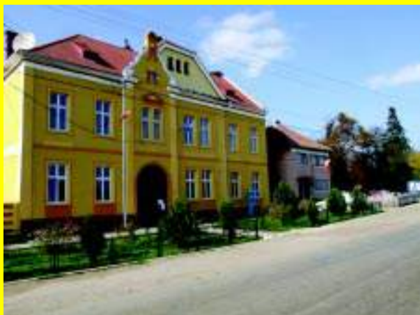
Primăria din Nocrich se reînnoiește